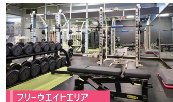
フリーウエイトエリア