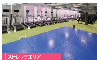
ストレッチエリア